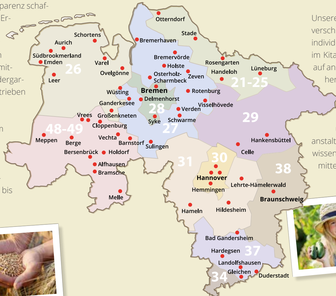
Übersicht der regionalen Bildungsträger in ihren jeweiligen Postleitzahlgebieten.

Das Projekt mit seiner Koordinierungsstelle in Barendorf bei Lüneburg fördert regionale Bildungsträger in ganz Niedersachsen und Bremen. Landesweit koordinieren und organisieren 50 Bildungsträger aus Landwirtschaft und Umweltbildung die Angebote an mehr als 400 außerschulischen Lernorten (siehe Karte).